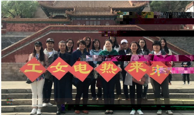
「三八婦女節」主題活動

每年，本集團為員工舉辦豐富多彩的文體活動，例如體育文化節、節日聯歡、電影觀看、趣味運動會、秋季旅遊、書畫作品展與園藝博覽會參觀等等，以促進員工工作與生活的平衡及加強員工之間的關係。